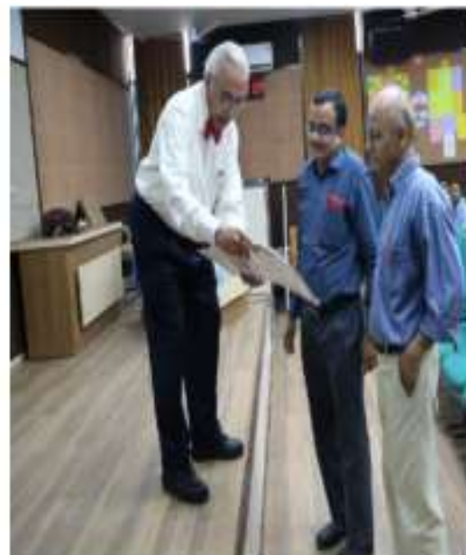
Dignitaries from Participating Universities