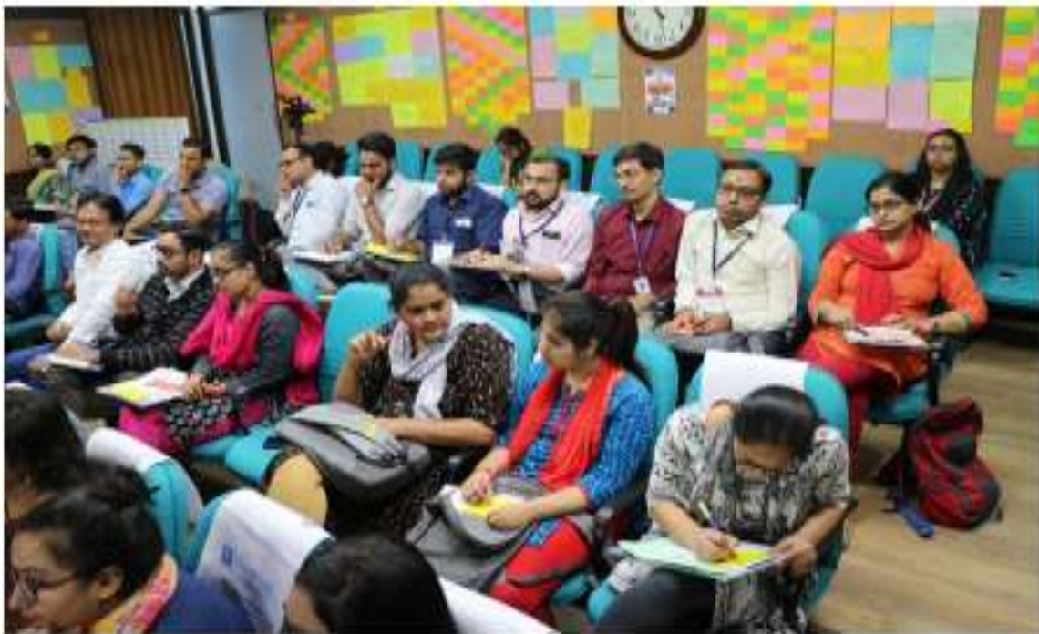
Participants @ Brainstorming Session - Individual Activities