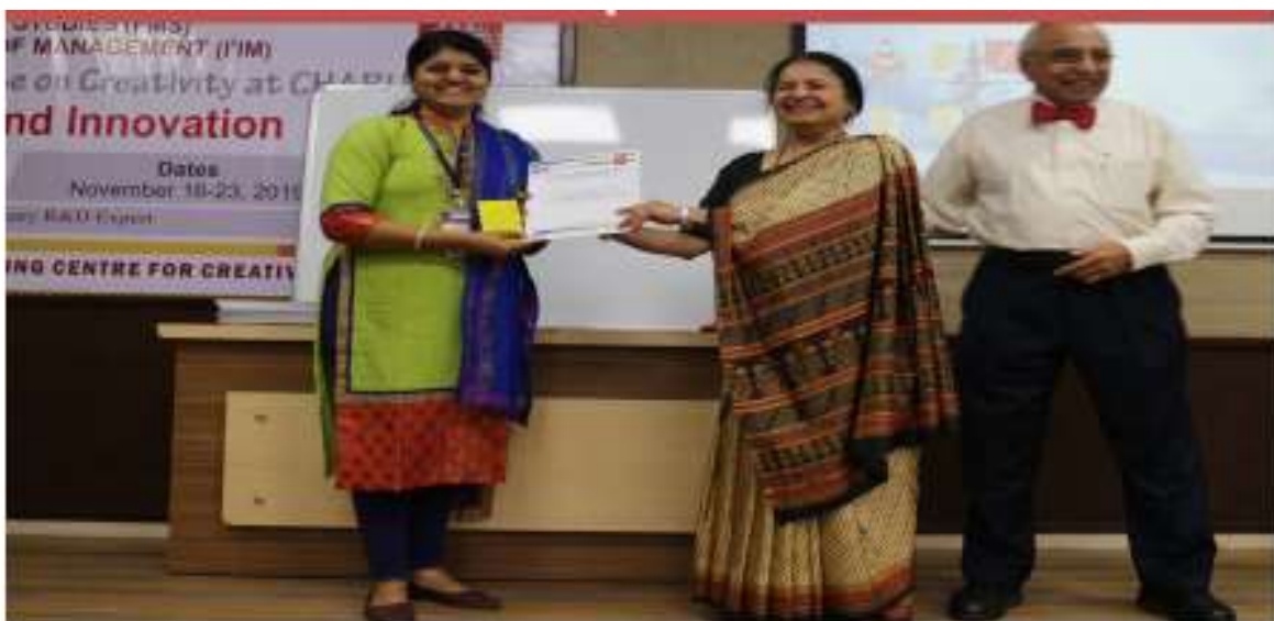
Faculty Members Awarded with Certificates at FDP-2019