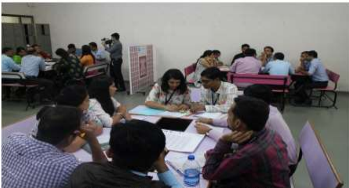
Participants Collaborating during the Group Activities