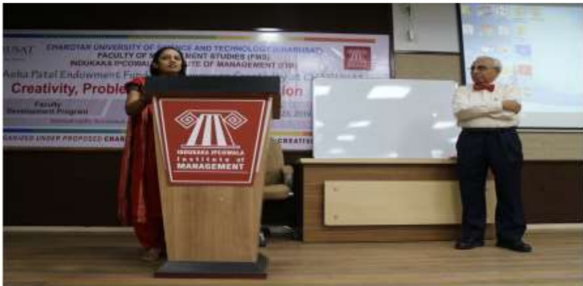
Feedback by Faculty Participants at FDP-2019